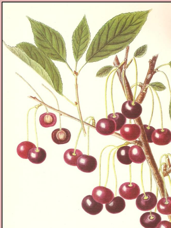
Ellen Bache's billed af Løvskal Kirsebær fra Anton Pedersens Danmarks Frugtsorter

"I Sammenligning med Stevnsbær er Væksten lavere og mere hængende, hvilket dog kan staa i Forbindelse med den store Frugt vægt. Aarsskuddene er ret korte og tynde. Barken er olivengrøn og forsynet med faatallige, gulgraa Porer. Bladene er smaa, ovale og med som Regel bred og kort Spids, de er faste, glatte, mørk mat-grønne og rendeformede. Bladranden har smaa, runde Takker. Bladstilken, der er ca. 1,5 cm lang, er tynd og grøn med ganske lidt rødlig Farve forneden, den er svag behaaret og med bred Fure."