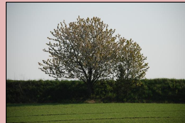
Kirsebærhybrid ved Karmark Mølle